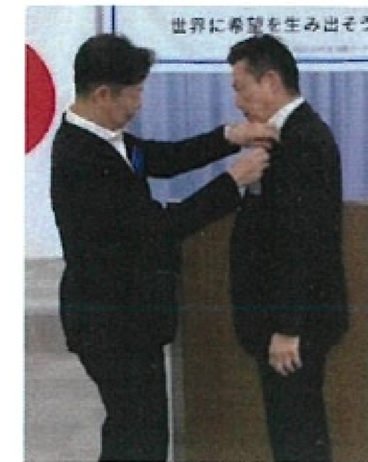
22-23年度角幹事から 23-24年度 南幹事へ