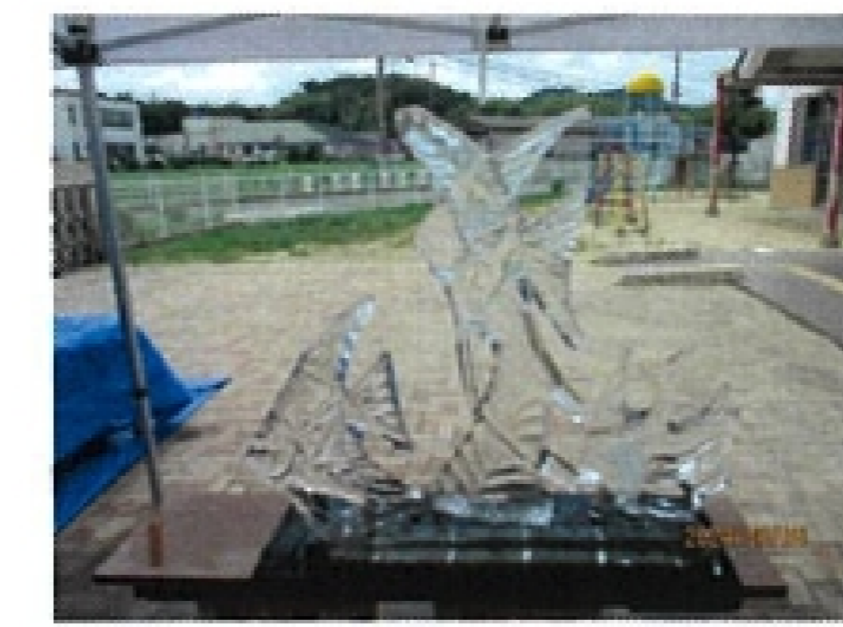
8月 結婚記念日 南 義彦会員