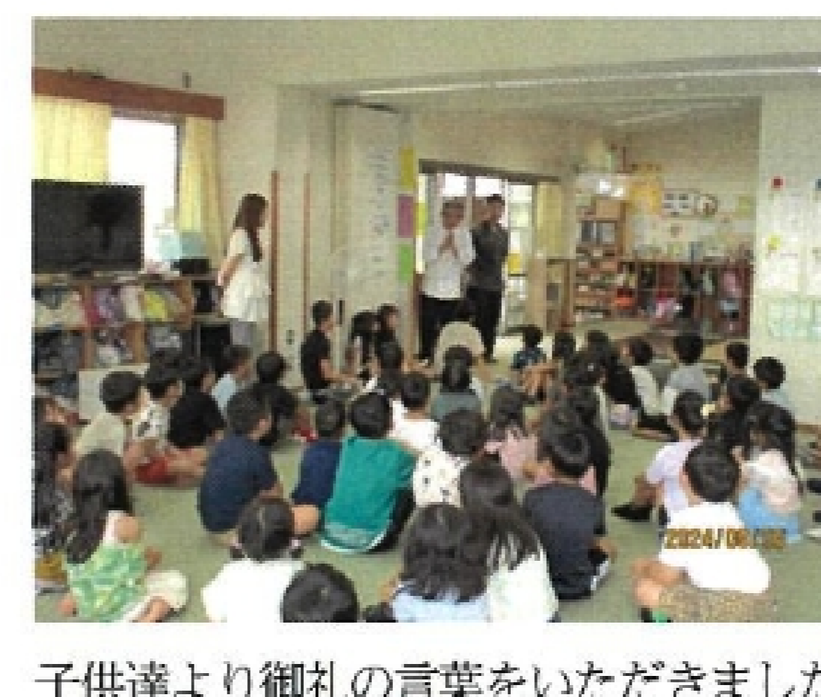
子供達より御礼の言葉をいただきました